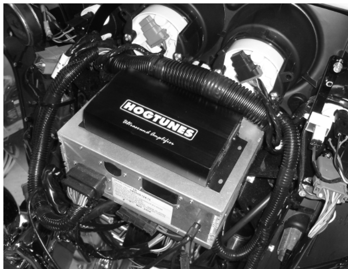
Diagram 1.1 (Classic Models/"Batwing" Fairings)

"Clippez " les haut parleur Hogtunes sur dans chaque grille de montage. Placez votre nouveau haut-parleur et sa grille de montage sur le carénage de l'enceinte , le rattacher utilisant les vis d'origine. Un tournevis est conseillé pour ceci.